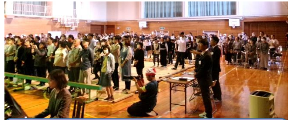
6年生と参観者のみなさんと、校歌を歌いました

当日は、おじいさんおばあさんの方からステージにいる子供たちに手を振る微笑ましい姿も見られて、心が温まりました。また、PTAのみなさんのご協力のもと、バザーや缶バッジ作製コーナーを実施していただきました。子供たちからは、「緊張したけど大きな声を出すことができた」「家族からたくさん誉められた」「缶バッジ作りが楽しかった」「小学校生活最後の学習発表会でよい思い出ができた」という感想が聞かれました。参観者の中には、「51年ぶりに校歌を歌いました」という方もおられて、それぞれに思い出深い一日となったようです。