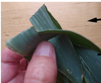
ひだりはしをおりこみます