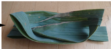
みぎはしもおりこみます