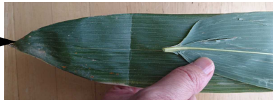
みぎがわをおります