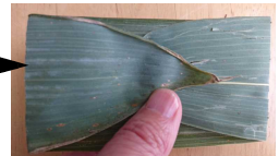
ひだりがわもおります