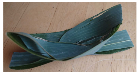
ふねのできあがり