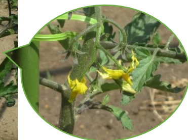
花がさいていました。