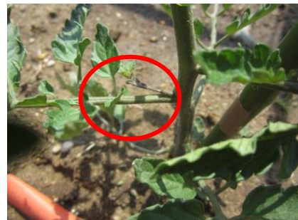
わきめをつみました。