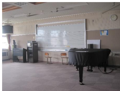
<だい1おんがくしつ>