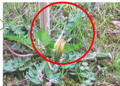
<きょうのタンポポ>