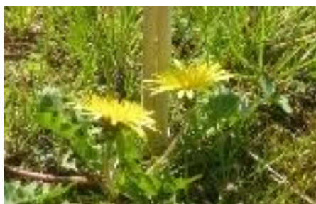
<きのうのタンポポ>

きょうは、きのうとちがってタンポポのきいろい花をあまり見かけませんでした。ほとんどの花が、しぼんでいました。このままかれていくのかな？